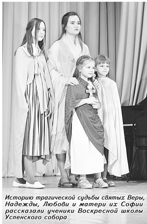
Историю трагической судьбы святых Веры, Надежды, Любви и матери их Софии рассказали ученики Воскресной школы Успенского собора

В пятый раз в Боровичах прошли Иаковские чтения, которые собрали в зрительном зале Дома народного творчества старшеклассников городских и районных школ, преподавателей, духовных лиц и представителей власти.