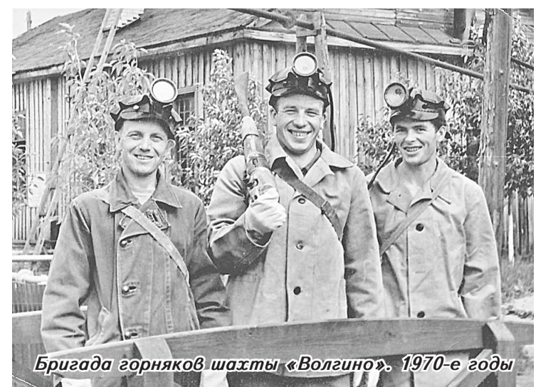
Бригада горняков шахты «Волгино», 1970-е годы