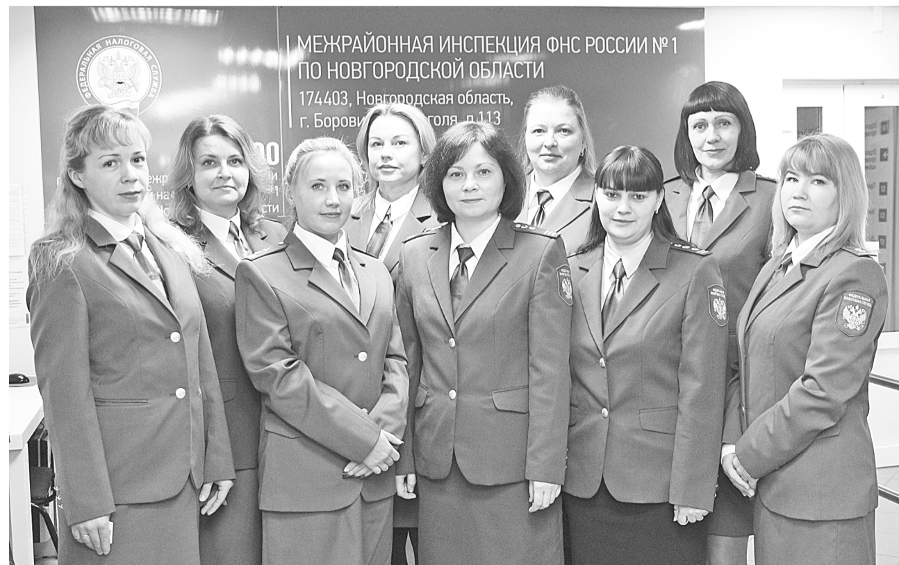
Сотрудники инспекции, отмеченные наградами к профессиональному празднику