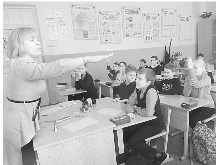
На уроке качества в 1-й школе